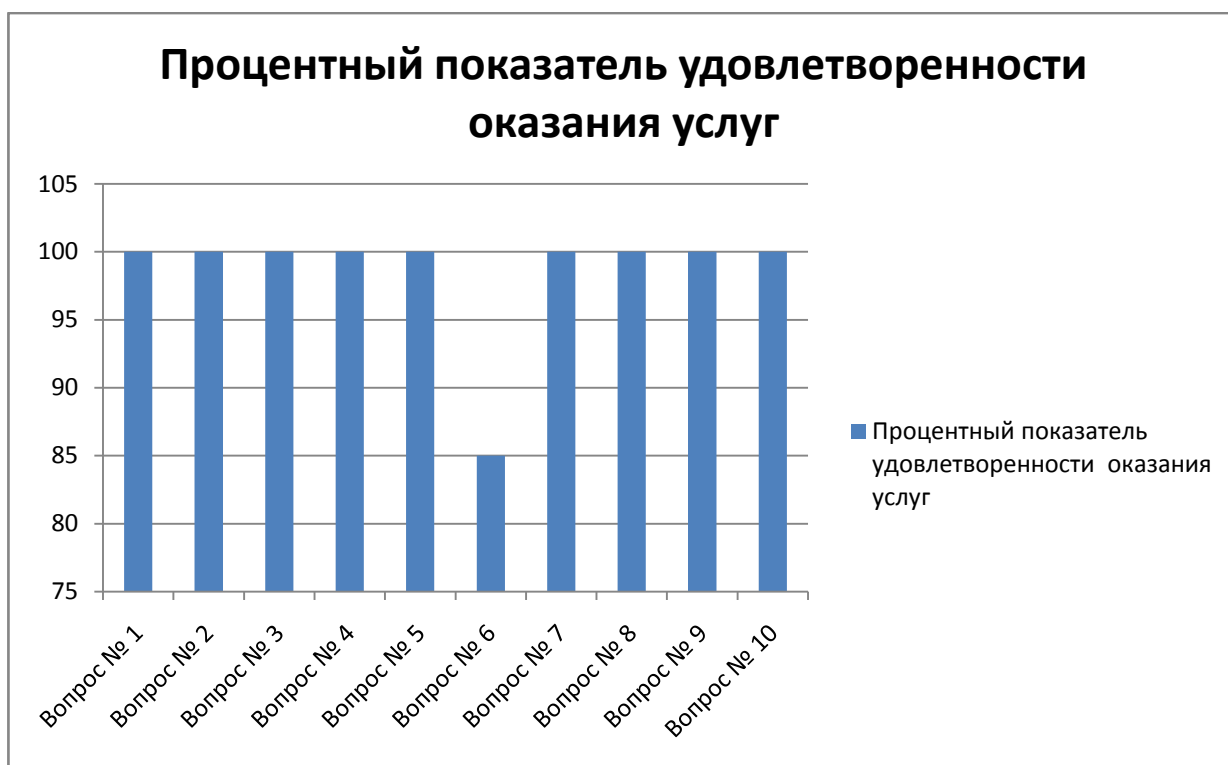
Диаграмма 1 независимой оценки качества предоставления услуг в ТОГБУ СОИ "Центр социальных услуг для населения Ржаксинского района"(телефонный опрос)

Анкетирование получателей социальных услуг при непосредственном посещении учреждения (30 граждан опрошены интервьюерами) показало следующие результаты: